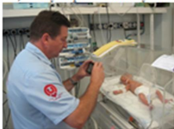
1) Fénykép az édesanyának