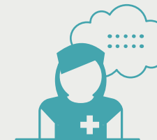
az esemény után