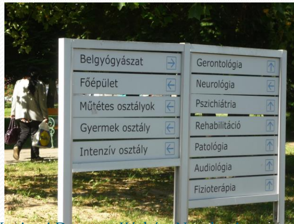
Kanizsai Dorottya Kórház, Nagykanizsa