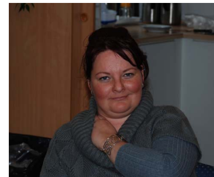
Pest Edina program koordinátor